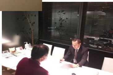
個別面談ブース内